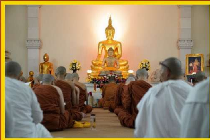
[ Puja bakti rutin pagi dan sore ]