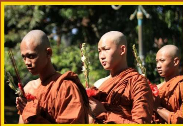
[ Prosesi penahbisan sāmaṇera ]