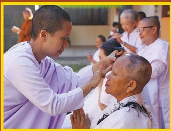
[ Cukur rambut calon aṭṭhasīlanī ]