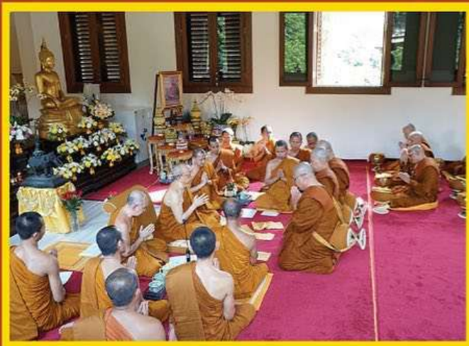
[ Prosesi upasampada bhikkhu ]